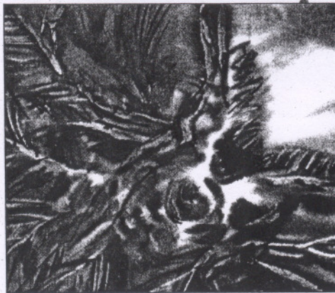
Petkes József: Agónia (1995)

* Elhangzott a Nemzeti kultúránk és irodalmunk kisebbségi körülmények között elnevezésű, Szabadkán megtartott tanácskozáson